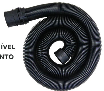
MANGUEIRA SUPER FLEXÍVEL ALCANÇA O COMPRIMENTO DE ATÉ 3,8M