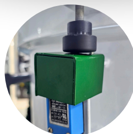
COM SENSOR DE SEGURANÇA