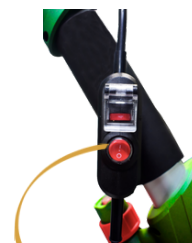
UNIDAD DE PERA