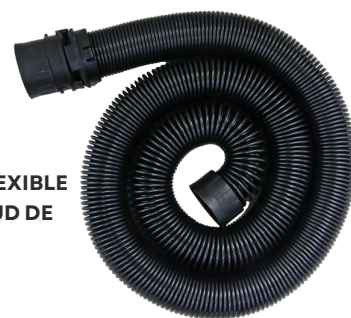
LA MANGUERA SÚPER FLEXIBLE ALCANZA UNA LONGITUD DE HASTA 4 METROS.