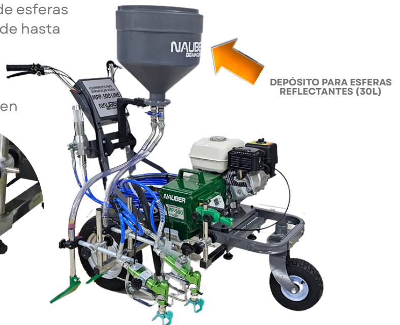
2 PISTOLAS PARA MARCAR EN TIRAS DOBLES

Incluye 02 pistolas pulverizadora Nauber Ultra, 02 Soporte de boquilla de aluminio Light Green, 02 Boquillas sin aire Light Green 215 y 01 manguera de 15 m.